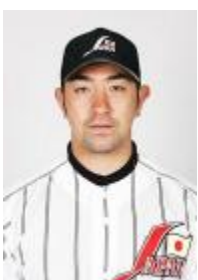
注)個人的趣味です